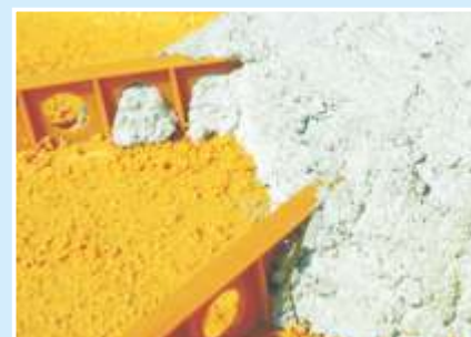
Haftbrücken für sicheren Betonverbund