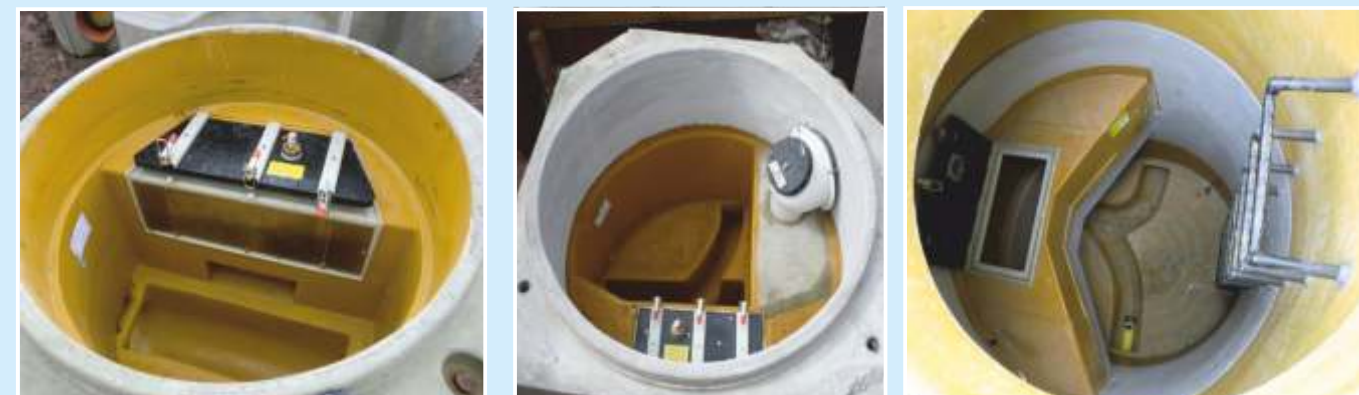
INFRA/ MULTRO-Schächte: Schmutzwasser und Regenwasser in einem Schacht