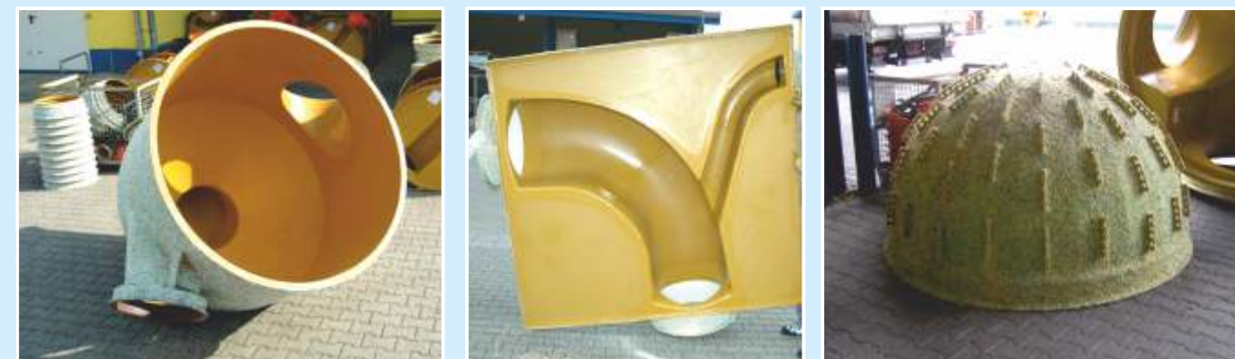
Sonderausführungen: Energievernichter-Schacht, Schachtböden für Rechteckschächte, Sand/Geröllfangschacht