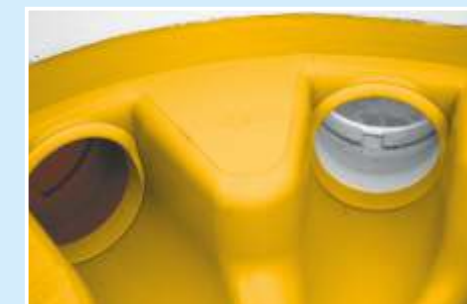
Zuläufe in allen Winkeln (auch nachträglich)