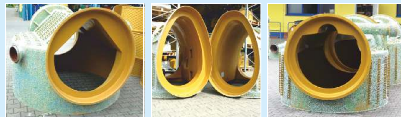
Sondergerinne: Drachensmaulprofil, Anschlüsse für Eiprofilrohre und Schachtböden mit Trockenwetterrinne