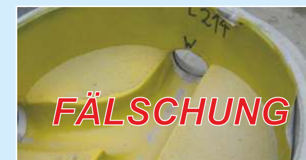
Schachtboden: Wandung min. 4 mm im Sohlbereich