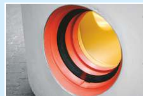
Anschluss aller Rohrarten möglich