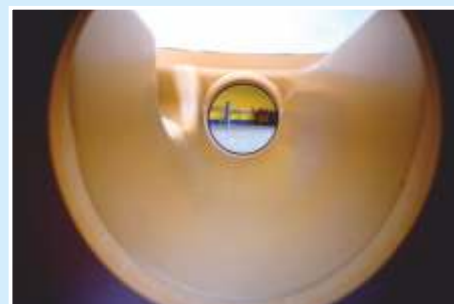
Gerinne fugenlos glatt, hydraulisch optimal