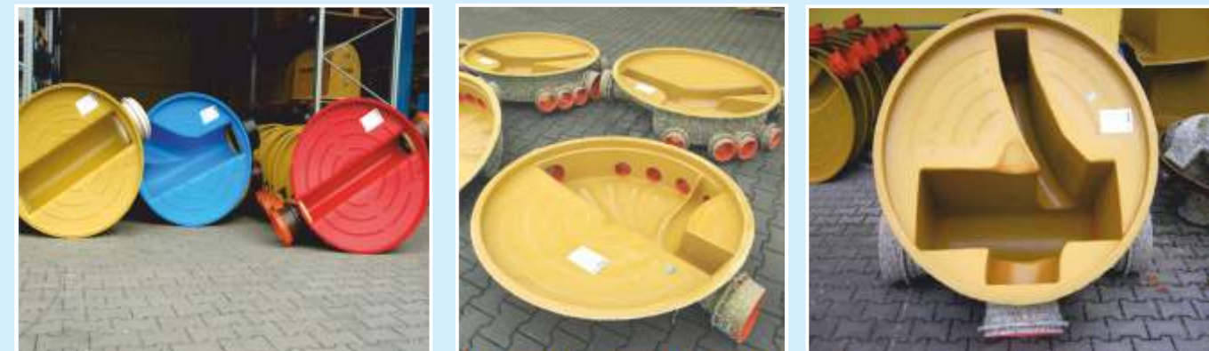
Standard-Schachtböden in PP, Sondertypen in GFK; auf Wunsch auch in Sonderfarben