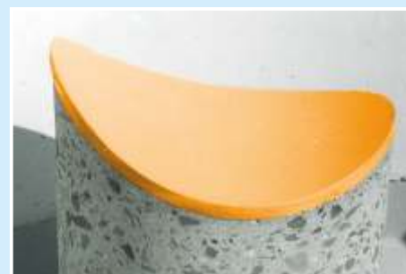
Betonqualität min. C40/50 durch Gießverfahren