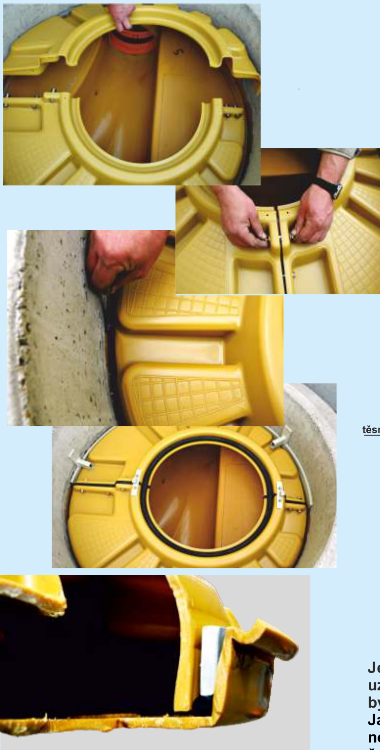
Šachta DN 1000 se zápachovým uzávěrem

Přístup k šachtovému dnu je umožněn uzavíratelným poklopem (550 mm). V případě potřeby se může místo poklopu použít zápachový filtr.