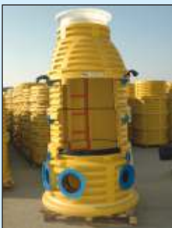
DN 1000 (PP)