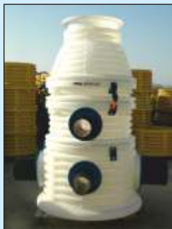
DN 1000 (PE)