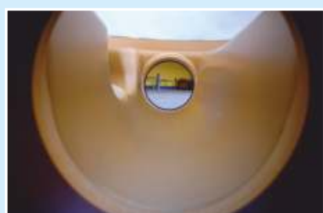
Canale artificiale perfettamente liscio, con ottima tenuta idraulica