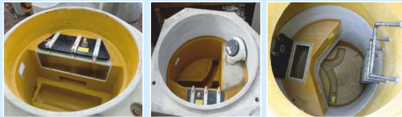
INFRA/MULTRO – Vasche per elementi di fondo : Acque Reflue e Acque Piovane nello stesso pozzetto.