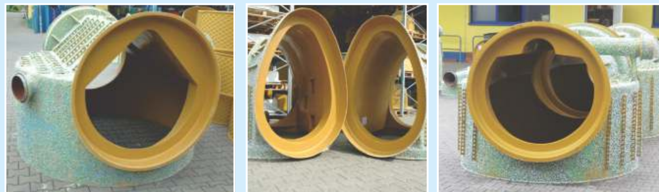
Canale con flusso speciale: Profilo speciale "Maul", profili per Tubi Ovoidali, Profili per elementi di base con canale per portate di magra.