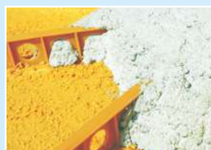
Ottima combinazione con agenti leganti per il calcestruzzo