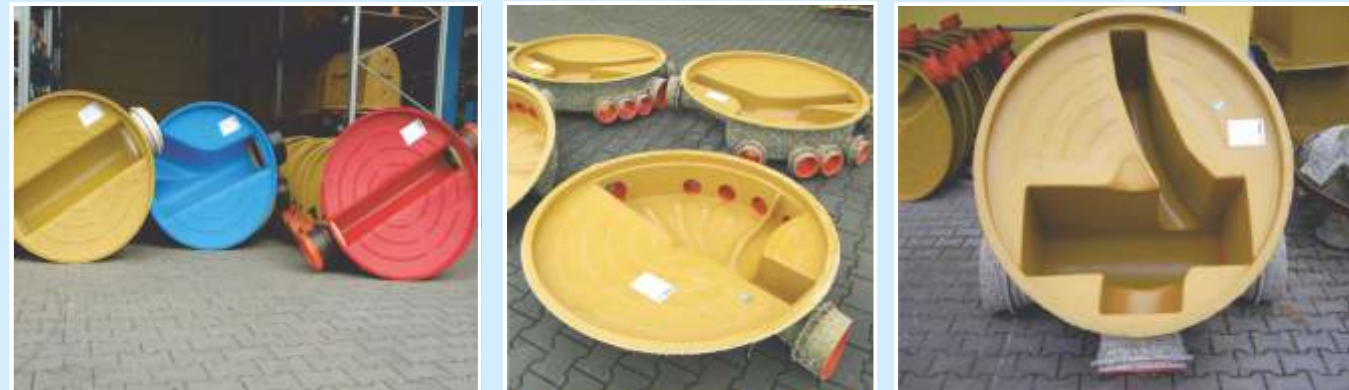
Vasche per elementi di fondo in PP, Pezzi Speciali in GFK, a richiesta anche con colori speciali.