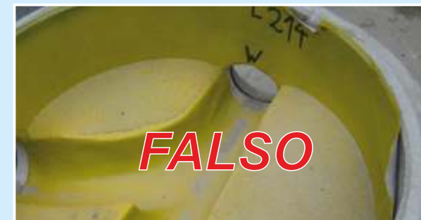
Rivestimento: spessore minimo 4 mm. nel canale di scorrimento