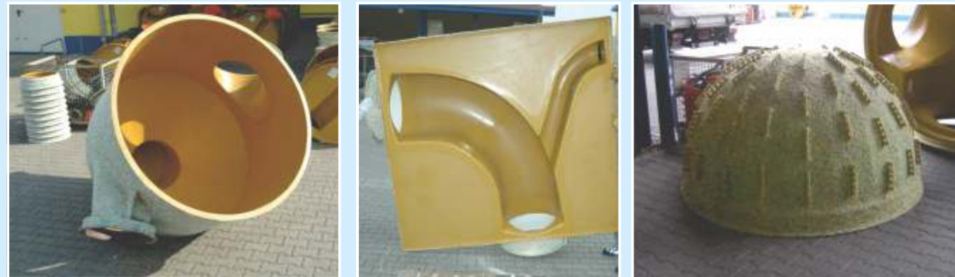
Versioni speciali : Dissipatore energetico, costruzioni a sezione rettangolare, deposito ghiaie.