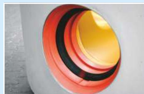
Possibilità di Innesti con qualsiasi tipo di tubo