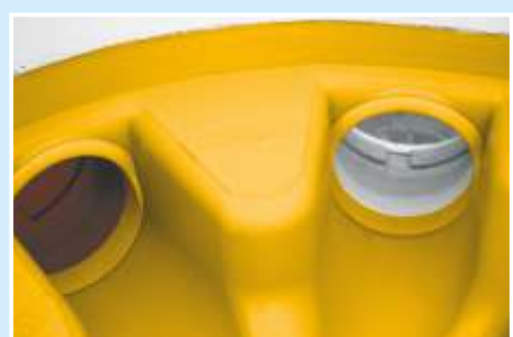
ingressi con qualsiasi angolazione (anche in sequenza)